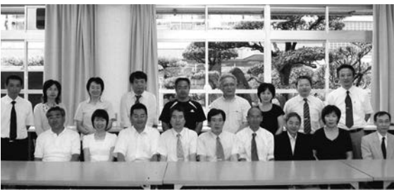
高校60期3年生の先生