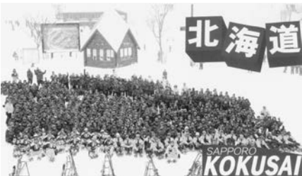
北海道スキー修学旅行 1998.2.3